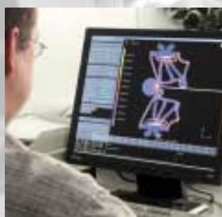
Finite Elemente Simulation